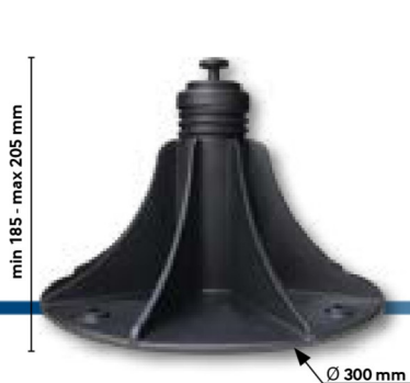
Cod. 9898-075-95 Versione regolabile Versión regulable Adjustable version