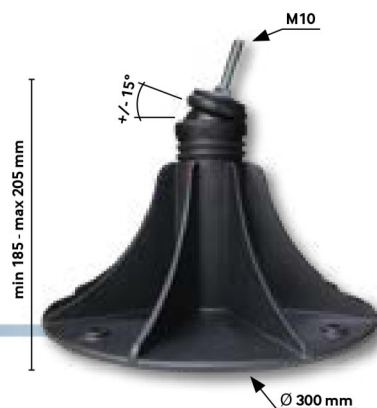
Cod. 9898-077-95 Versione regolabile adattabile con ralla + vite Versión ajustable y regulable con tornillo y bola Adjustable version with spherical joint and screw